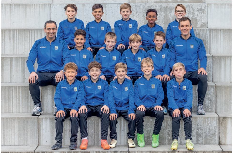
Junioren Da 7er Fussball

Für die B-Junioren war die Vorrunde 2024 eine besondere Herausforderung. In einer hart umkämpften Liga mussten sie sich gegen starke Gegner behaupten. Die Mannschaft zeigte über die gesamte Saison hinweg grossen Teamgeist und gab in jedem Spiel alles. Mit dem starken Schlussrang in