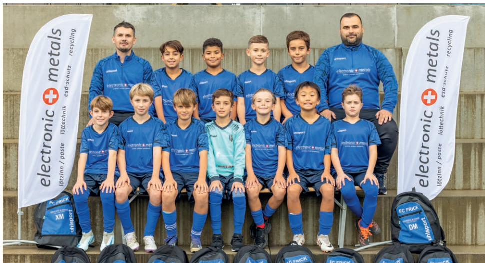
Junioren Ea mit neuem Dress

Die F- und E-Junioren Teams legten eine grossartige Vorrunde hin. Die jungen Talente waren mit grossem Einsatz und viel Freude dabei und entwickelten sich spie-