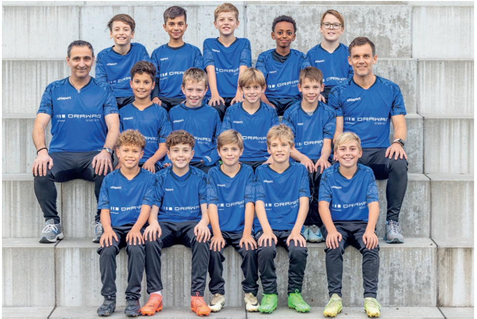
Neue Trainingsausrüstung für das Team D7a, gesponsert von der Drawag AG

2024 konnte der Vertrag um weitere 3 Jahre verlängert werden. Der FC Frick bedankt sich bei der DRAWAG AG und Dipek Khunti für die grossartige Unterstützung.