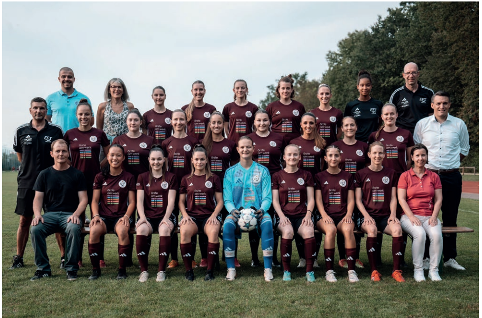
FFT Fricktal 1 mit dem neuen Dress und den Sponsoren

höhe duellierten. Man könnte gar sagen, dass das Team aus dem Fricktal in der ersten Halbzeit mehr vom Spiel hatte. Mit viel Tempo und einem kämpferischen, aber dennoch gepflegten Spiel nach vorne überrannte man die Gegnerinnen ein ums andere Mal und konnte bereits in der fünfzehnten Minute mit 0:1 in Führung gehen. Auch in der Folge hatte man die Überhand, musste dann aber kurz vor dem Halbzeitpfiff den Ausgleich hinnehmen. In der zweiten Halbzeit änderte sich lange nichts am Resultat. Man merkte jedoch, dass die Kräfte beim FFT langsam nachliessen. Man konnte nicht mehr das gleiche Tempo anschlagen wie in der ersten Halbzeit und verlor etwas das Konzept. Dies eröffnete den Gegnerinnen Räume und Chancen,